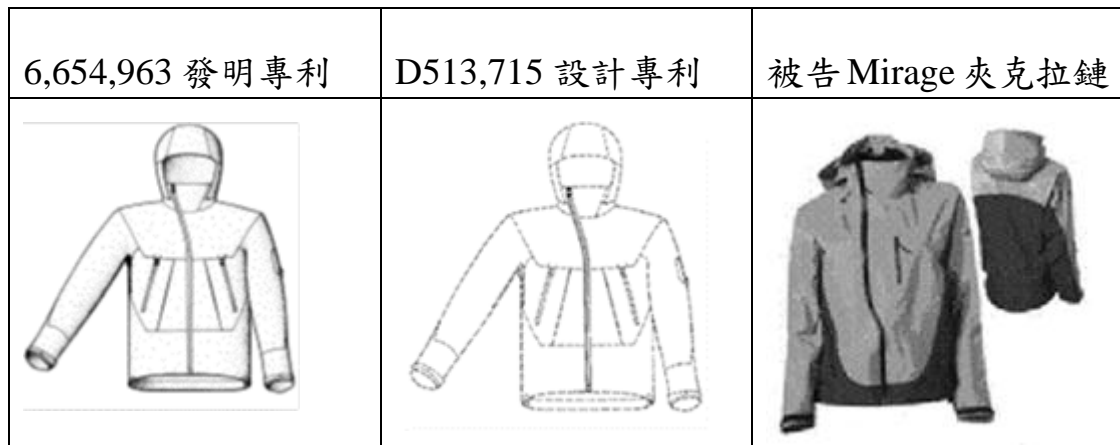
圖 2 Arc'teryx 公司的 715 專利與發明專利與被告產品之比對

依據 CAFC 在 Egyptian 的決定,法院不以文字詳細解讀設計專利保護的範圍,也不去比對 715 專利與被告產品的拉鏈的細部差異,而是比對 715 專利與被告產品的拉鏈留給一般觀察者的視覺印象。是以戶外服裝的購買者做為一般觀察者,他們的觀察比一般消費者更敏銳,識別能力強於一般消費者。將 715 專利與被告產品以及先前技藝一起比對,先前技藝包含:lowe Alpine 的夾克(如圖 3 左側所示)與德國 40 18 356 發明專利(如圖 3 中央與右側所示,簡稱 DE 356 專利)。將夾克上拉鏈直線部分的長度與相關配置、對角斜彎部分的長度與相關位置也一併納入考量。